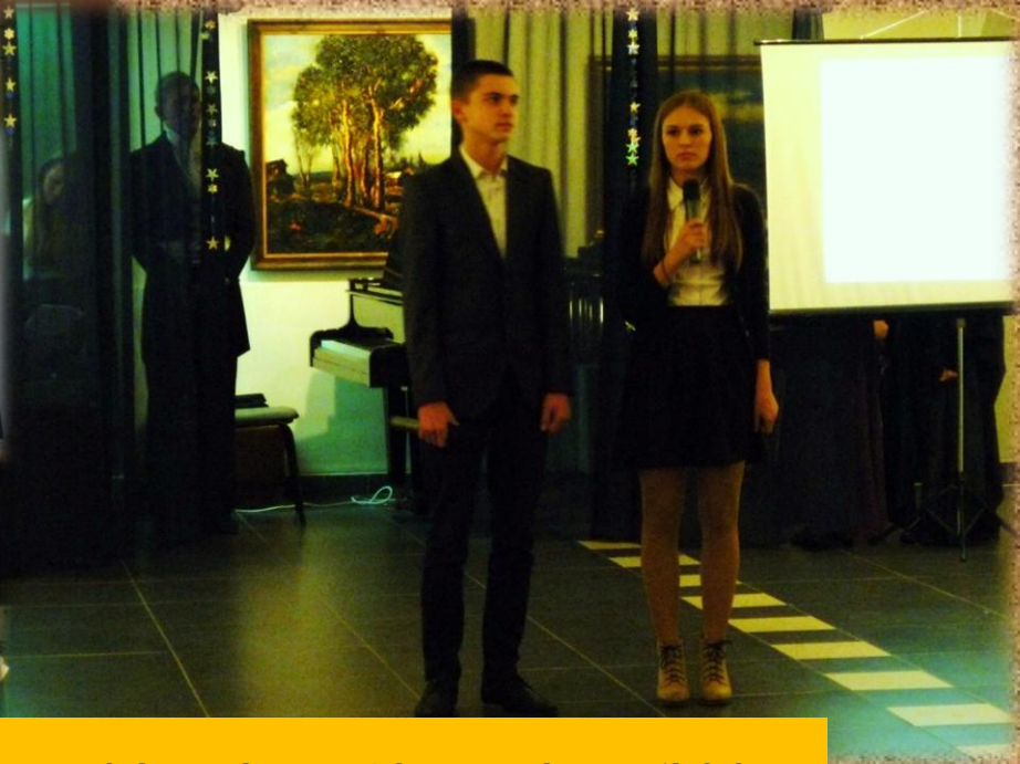
Плодотворное сотрудничество школы с музеем